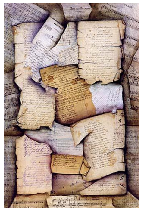
Page de musique