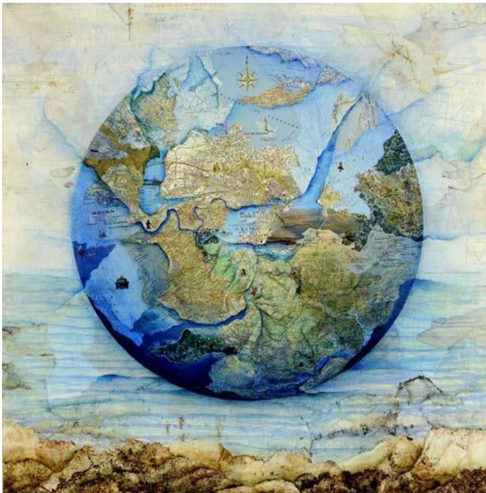
« Terraqué » 2005

Depuis 2002, son travail intègre l'outil informatique et ses images numériques. Son œuvre est figurative .