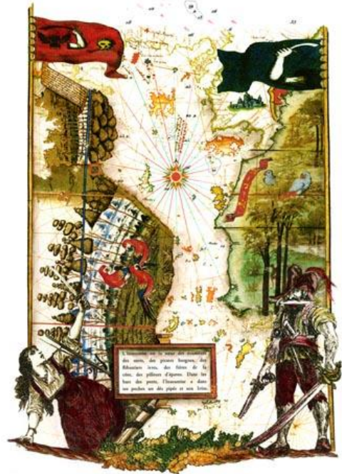
« Le Portulan de l'Insoumise » planche 2